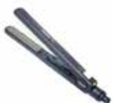
PLANCHA DE CABELLO