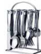
SET DE CUBIERTOS