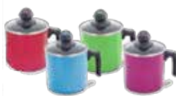
1 JARRO DE COLOR