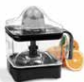
EXPRIMIDOR DE JUGO