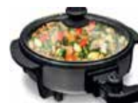
SARTEN WOK ELÉCTRICO