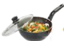
WOK CON TAPA DE VIDRIO