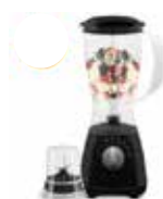
LICUADORA DUO MIX