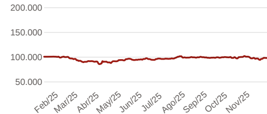
9.1 Evolución de 100.000 COP invertidos hace 5 años