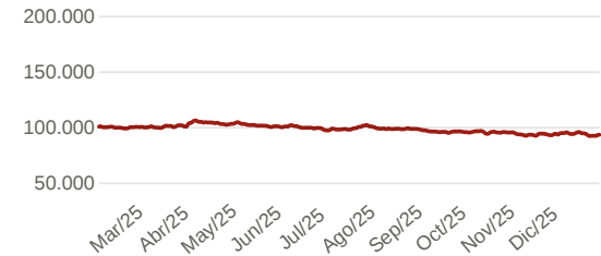
9.1 Evolución de 100.000 COP invertidos hace 5 años